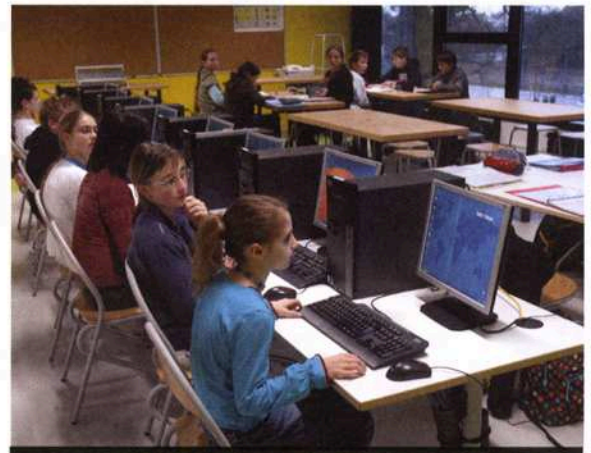
Le collège est équipé des technologies de l'information et de la communication

Dès le parvis, la multitude de vélos donne le ton : nous sommes ici dans un collège à part, déjà à la campagne, et respirant le grand air. L'architecture est originale, les murs intérieurs sont colorés et les fenêtres sont de véritables baies vitrées donnant sur des espaces verts.