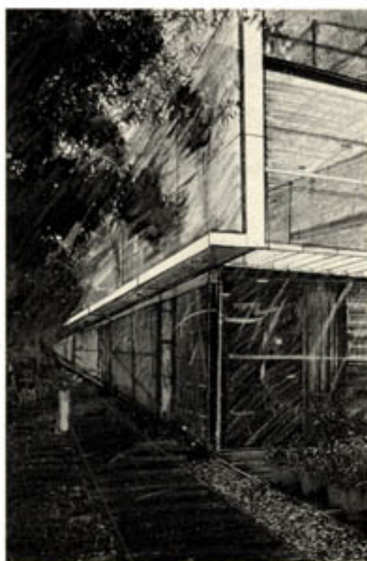
Perspectief centrale ruimte

Onlangs werd het opdrachtgeverschap voor het woningbouwplan Steynhof door de Ontwikkelingscombinatie Wateringse Veld overgedragen aan Bouwfonds Woningbouw. Het ontwerp voor Steynhof is van Pierre en Marjolijn Boudry, winnaars van de vierde Europeanprijsvraag. Bij de overdracht benadrukte de Ontwikkelingscombinatie ervan overtuigd te zijn dat het voorlopig ontwerp een (ook financieel) haalbaar plan zal opleveren. Verder werd het vertrouwen uitgesproken dat Bouwfonds Woningbouw zich zal inzetten de bijzondere kwaliteiten van het plan te behouden. De feestelijke overdracht van het opdrachtgeverschap vond in klein gezelschap plaats, in aanwezigheid van European Nederland.