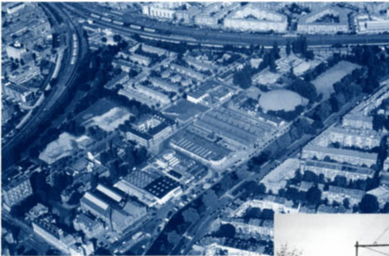
De locatie Polderweggebied in Amsterdam-Oost