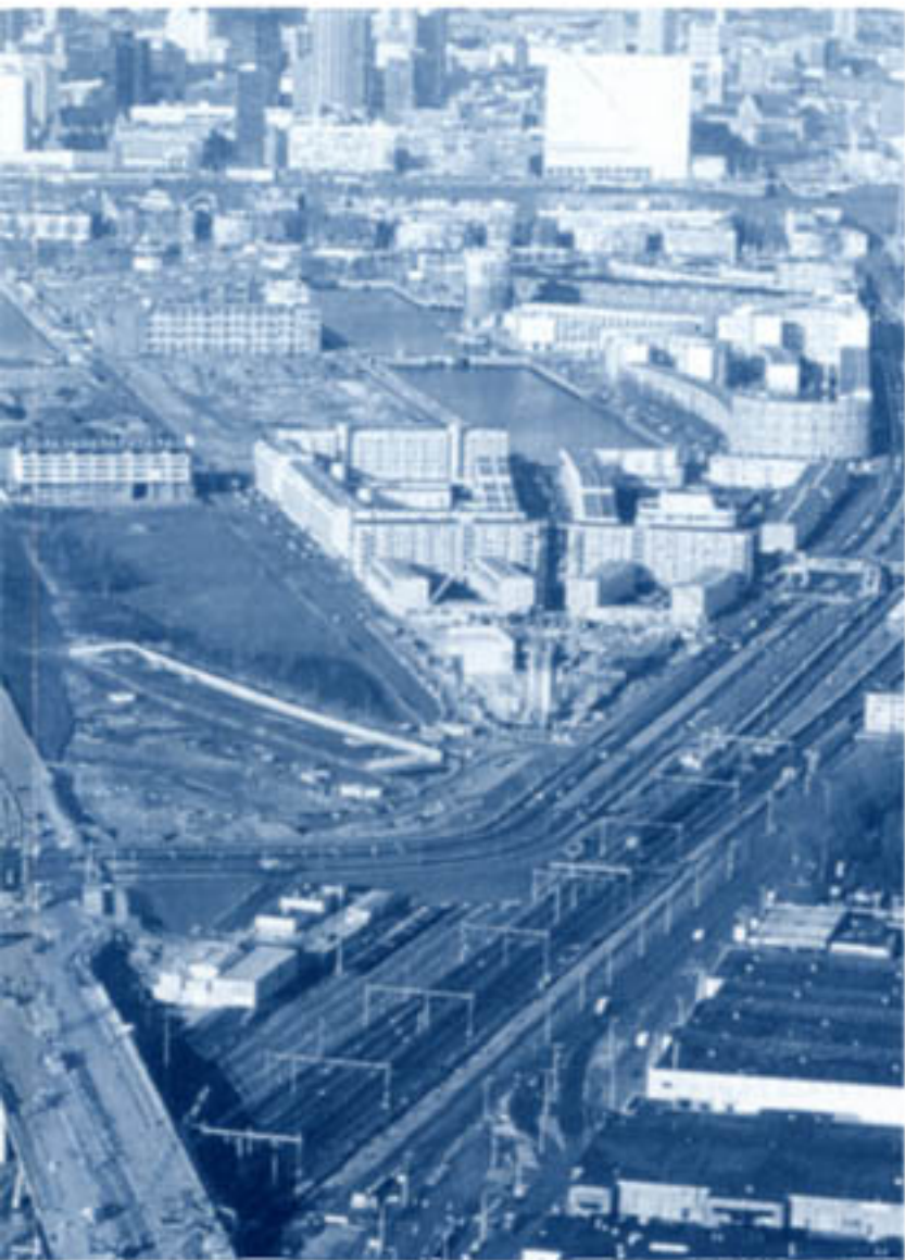
De locatie Kop van Zuid in Rotterdam