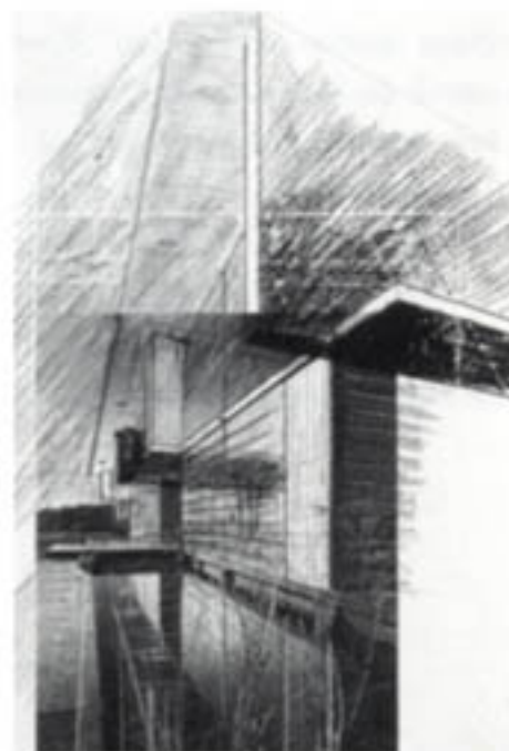
Gevelaanzicht woningen Steinhof

Bezoekadres: Museumpark 25 in Rotterdam.